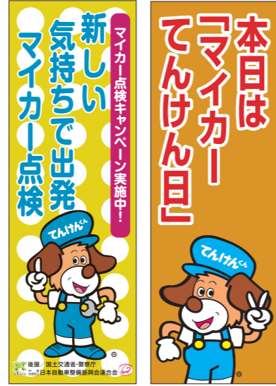
1 のぼり旗 (キャンペーン用) 2 のぼり旗 (マイカーてんけん日用)

■のぼり・横断幕に表示している標語は、令和元年度のもです。令和2年度ののぼり・横断幕には、新しい標語が入ります。令和2年度の標語選定テーマは、「点検・整備に関するユーザーの意識向上」です。