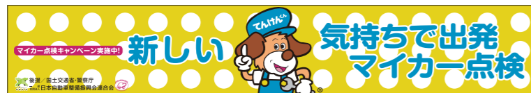
5 横断幕 [中]

■のぼり・横断幕に表示している標語は、令和元年度のもです。令和2年度ののぼり・横断幕には、新しい標語が入ります。令和2年度の標語選定テーマは、「点検・整備に関するユーザーの意識向上」です。