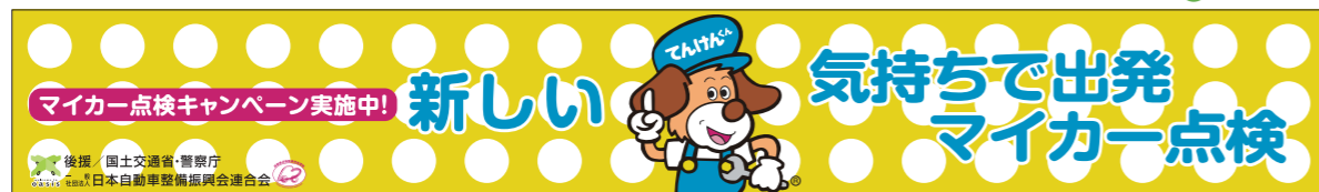
6 横断幕 [大]